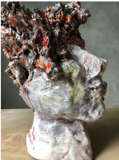
Mouche / Beauty Spot 2022

Sculpture in earthenware and ostrich feathers H24 x W17 x 19 cm (without feather)