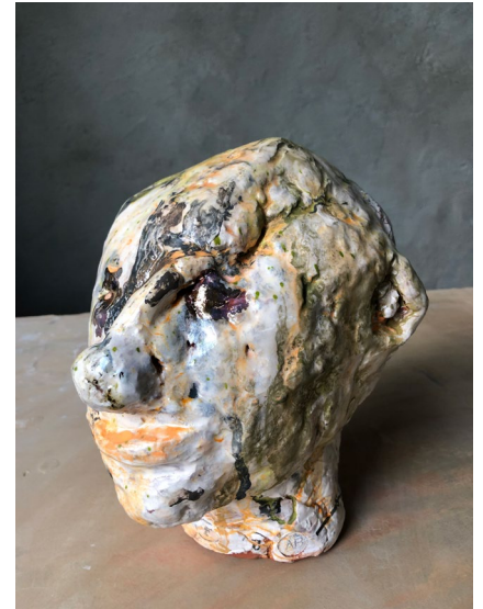
Hen / Them 2022

Sculpture in earthenware with cigarillo H31 x W19 x D21 cm