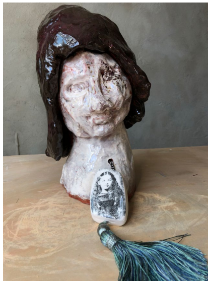
I Blickfånget / Eyecatcher 2022

Sculptures in earthenware H20 x W17 x D24 cm (hon) H20 x W16 x D21 cm (han)