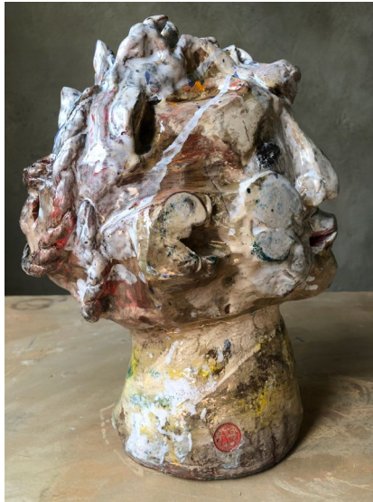
Chinjong / Chignon 2022

ANNA BERGMAN JURELL HOW IT USED TO BE 29/9—5/11