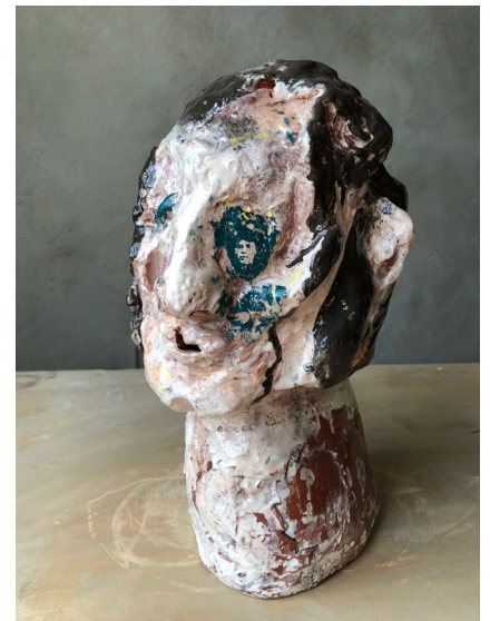
På Näthinnan / On the Retina 2022

Sculpture in earthenware with mustache of espriter. H34 x W20 x D25 cm