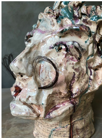
Mustasch / Mustache 2022

Sculpture in earthenware and beard stubble in plastic. H36 x W21 x D26 cm