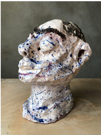
Monokel / Monocle 2022

Sculpture in earthenware with hat pins H28 x WW16 x D22 (without hat pins)