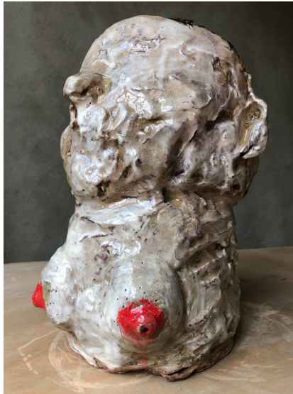
Manlig Byst / Male Front 2022

ANNA BERGMAN JURELL HOW IT USED TO BE 29/9—5/11