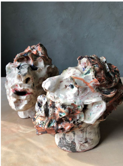
Hon och Han / She and He 2022

Sculpture in earthenware H24 x W19 x D23 cm