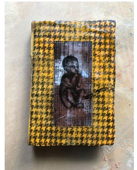
Begynnelsen / The Beginning 2022

Wall hung breast in porcelain clay 14 x 14 x 6 cm