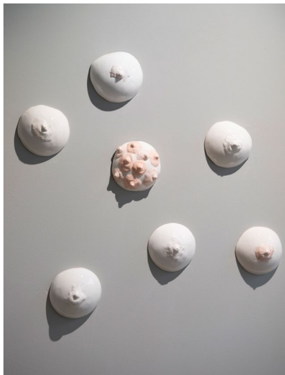
Hängbröst / Sagging Breast 2022

Sculpture in earthenware H29 x W21 x D25 cm