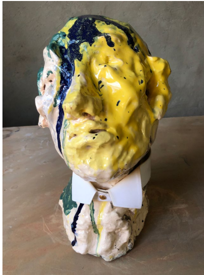
Stärkkrage / Wing Collar 2022

ANNA BERGMAN JURELL HOW IT USED TO BE 29/9—5/11