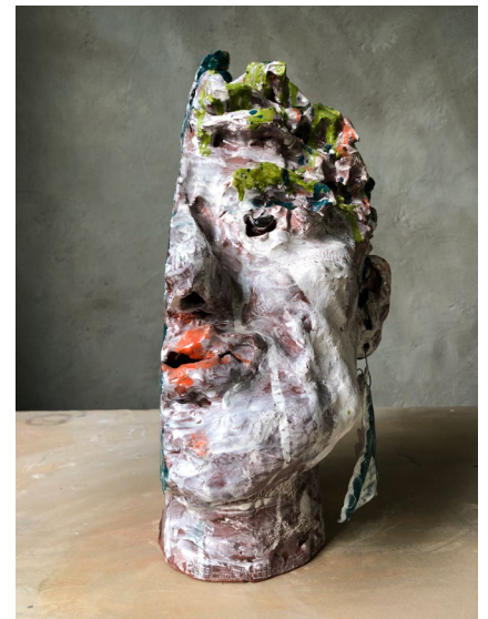
Karriärskvinna / Career Woman 2022

Sculpture in earthenware with medallion in porcelain clay and silk tassel. H 31 x W17 x D18 cm (without medallion)