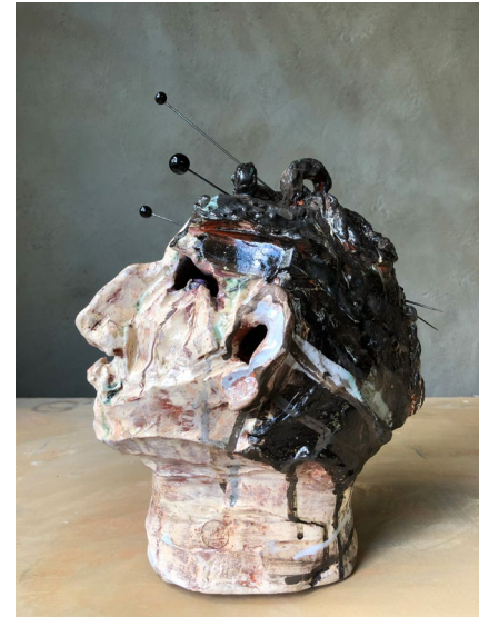
Suffragett / Suffraget 2020

Sculpture in earthenware, stiff collar and collar button H29 x W16 x D22 cm