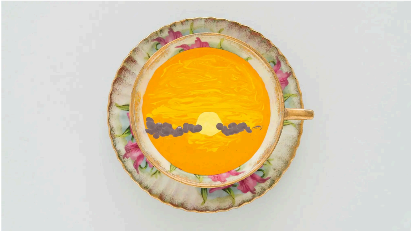
Verk av Spencer Finch i serien "Sunset in a cup" på Galerie Nordenhake.

Höstsäsongen har dragit i gång på Stockholms gallerier. Bo Madestrand gör en rond och noterar flyttar till Östermalm, liksom naturintryck i både abstrakta eller mer direkta och sinnliga former.