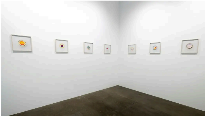
Vy med verk av Spender Finch på Galerie Nordenhake.

Här låg tidigare lampföretaget Flos showroom – en händelse som ser ut som en tanke. Första utställare i det nya galleriet är nämligen den amerikanska konstnären Spencer Finch, som arbetar just med ljus och färger i sin konst.